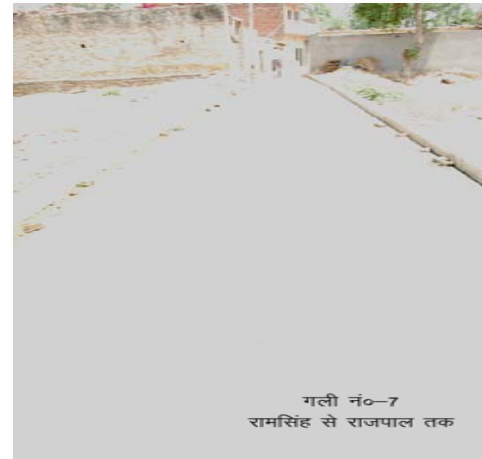
गली नं०-7 रामसिंह से राजपाल तक