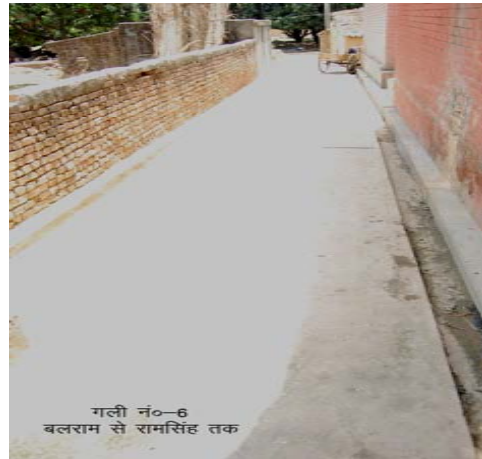
गली नं०-6 बलराम से रामसिंह तक