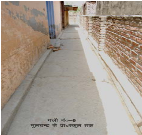
गली नं०-9 मूलचन्द्र से प्रा०स्कूल तक