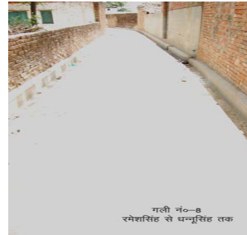
गली नं०-8 रमेशसिंह से धन्सिंह तक