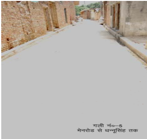
गली नं०-5 मेनरोड से धन्सिंह तक