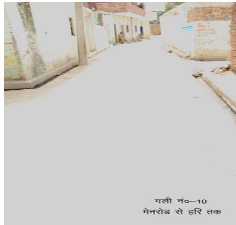
गली नं०-10 मेनरोड से हरि तक