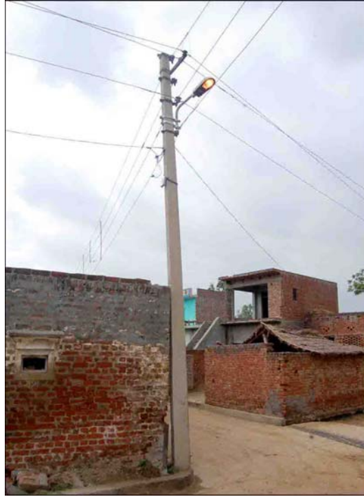
( 1 )