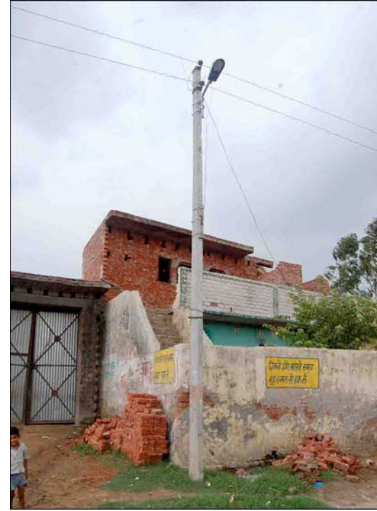
( 2 )