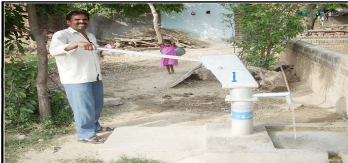
लोकेशन-हरकेश बिहारी के पास में