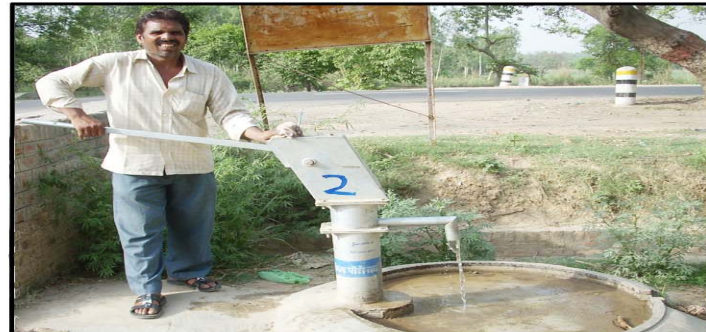
लोकेशन-रोशन कालेज के पास में