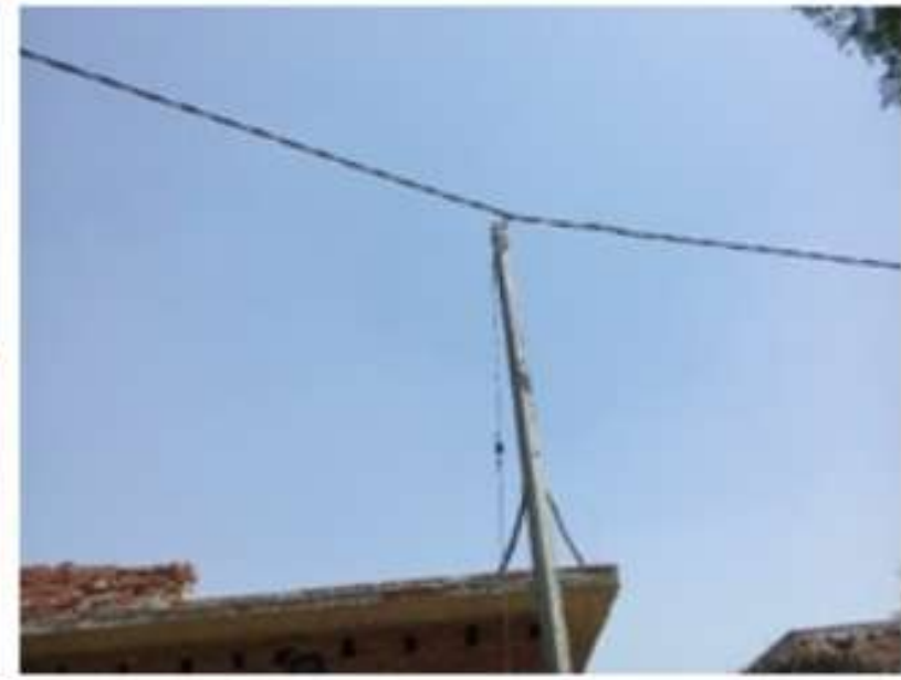
ग्राम खुरमपुर डल्लू में कराये गये विद्युतीकरण कार्यों के फोटोग्राफ