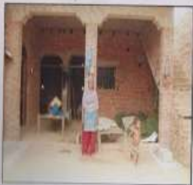
13. स-तोष w/. होटन अनु.