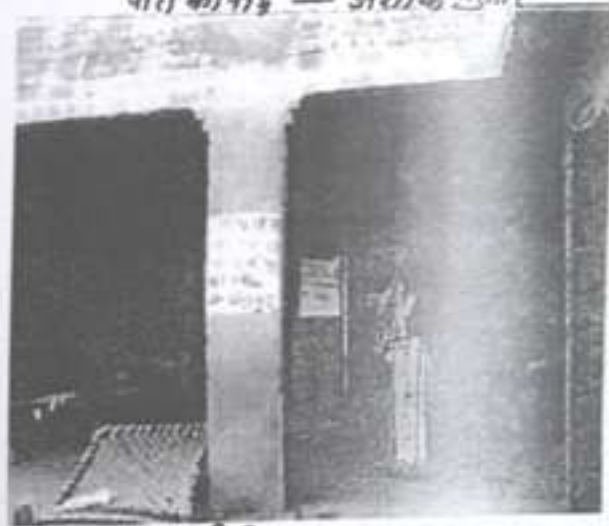
गांव - मिहेंपुर