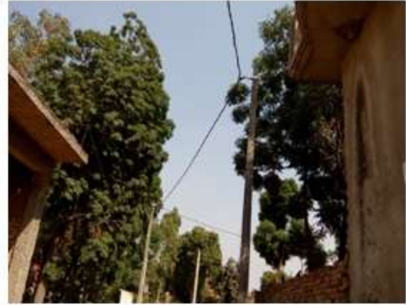
ग्राम मिठठेपुर में कराये गये विद्युतीकरण कार्यों के फोटोग्राफ